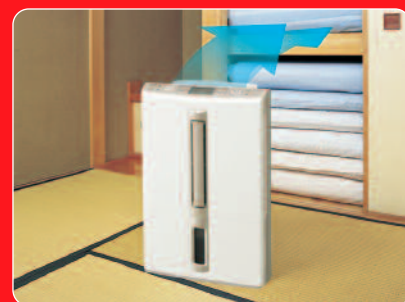
Achterwaardse swing uitblaas