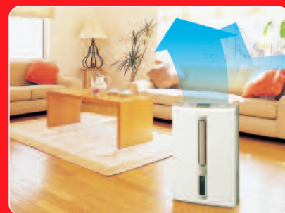
Opwaardse swing uitblaas